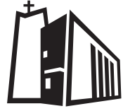
OLV ter Nood