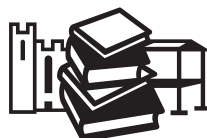
Boeken rond het Paleis