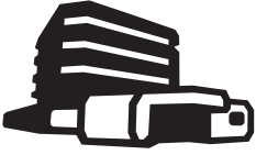
het blauwe gebouw