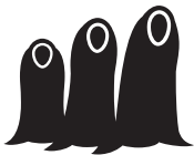
Zusters in staal